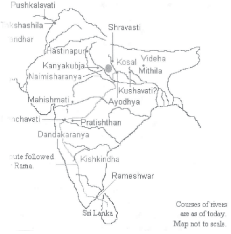
चित्र 7.1: वाल्मीकि-कालीन भारत का मानचित्र